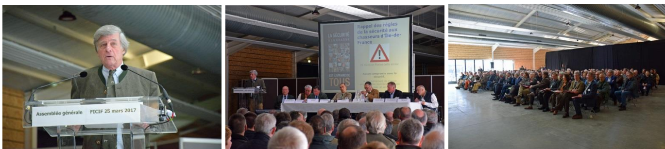
Discours du Président Thierry Clerc devant plus de 200 adhérents réunis le samedi 25 mars 2017 à Mantes-la-Jolie.