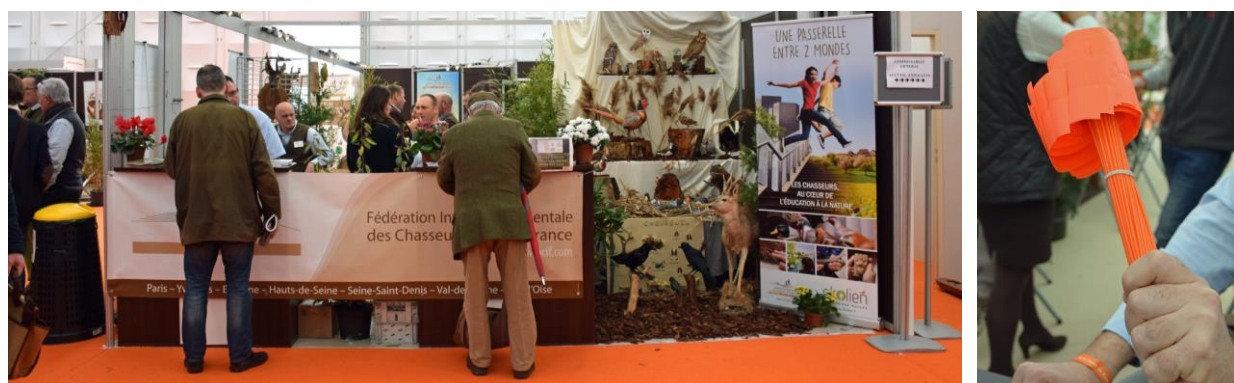
Stand de la FICIF lors de l'édition 2017 du Salon de la Chasse à Mantes-la-Jolie où les visiteurs sont venus se renseigner sur les formations proposées par la Fédération et ont reçu des piquets de battue en échange de leur participation à l'enquête FICIF .