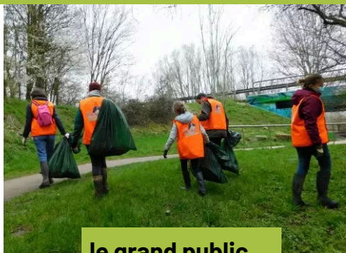
le grand public ...