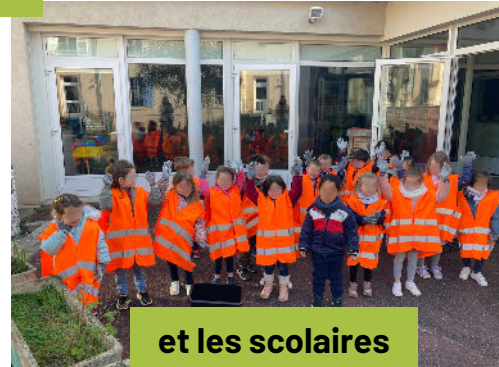
et les scolaires mobilisés !

+ de 150 m 3 de déchets ramassés sur 32 points de collecte